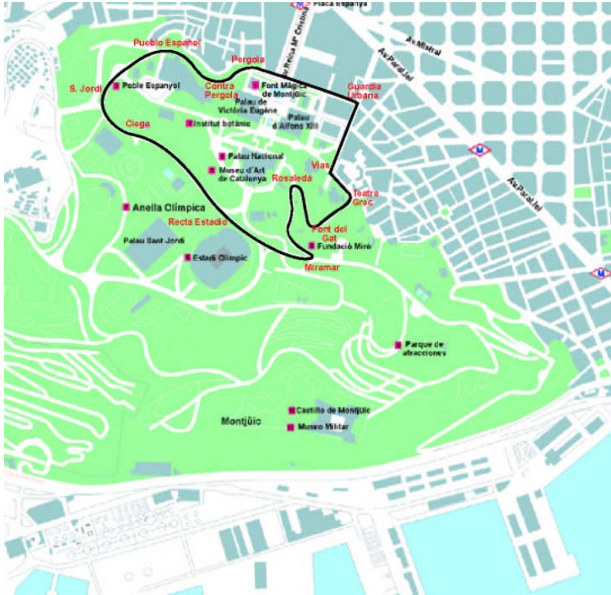
Antiguo trazado del Circuito.